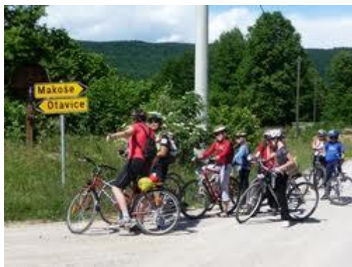
Izlet s kolesi (učenci predmetne stopnje)