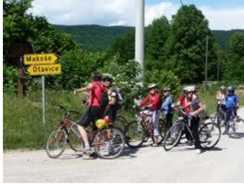
Izlet s kolesi (učenci predmetne stopnje)