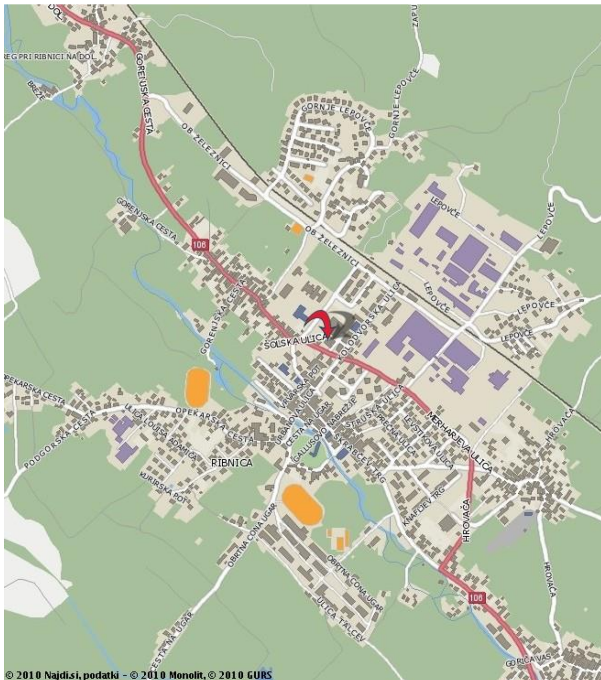
Zemljevid bližnje okolice šole in cest