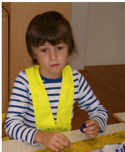
Učenka z rumeno rutico

Jutranje varstvo je organizirano za učence 1. razreda na matični šoli, na podružnici Dolenja vas in na podružnici Sušje.