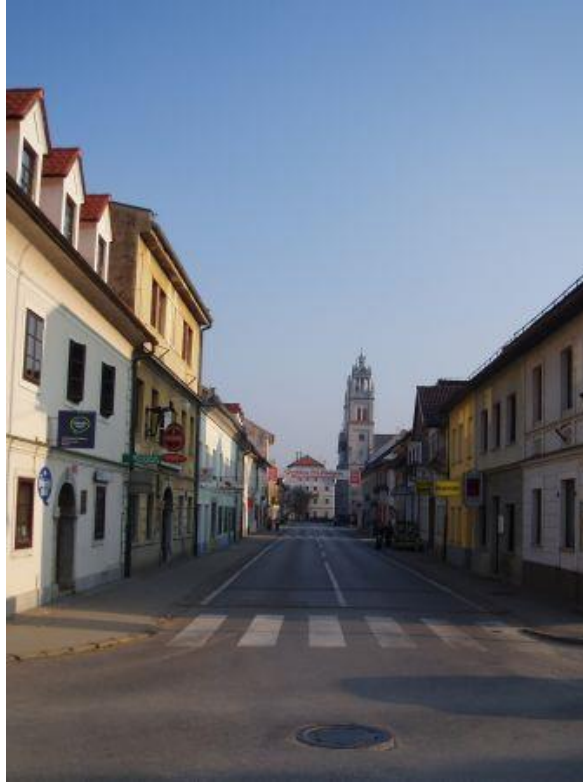
Center Ribnice z nevarnim ozkim delom pločnika ob Johanovi hiši